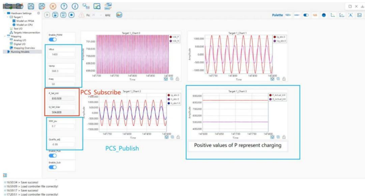
HIL 上位机界面测试波形